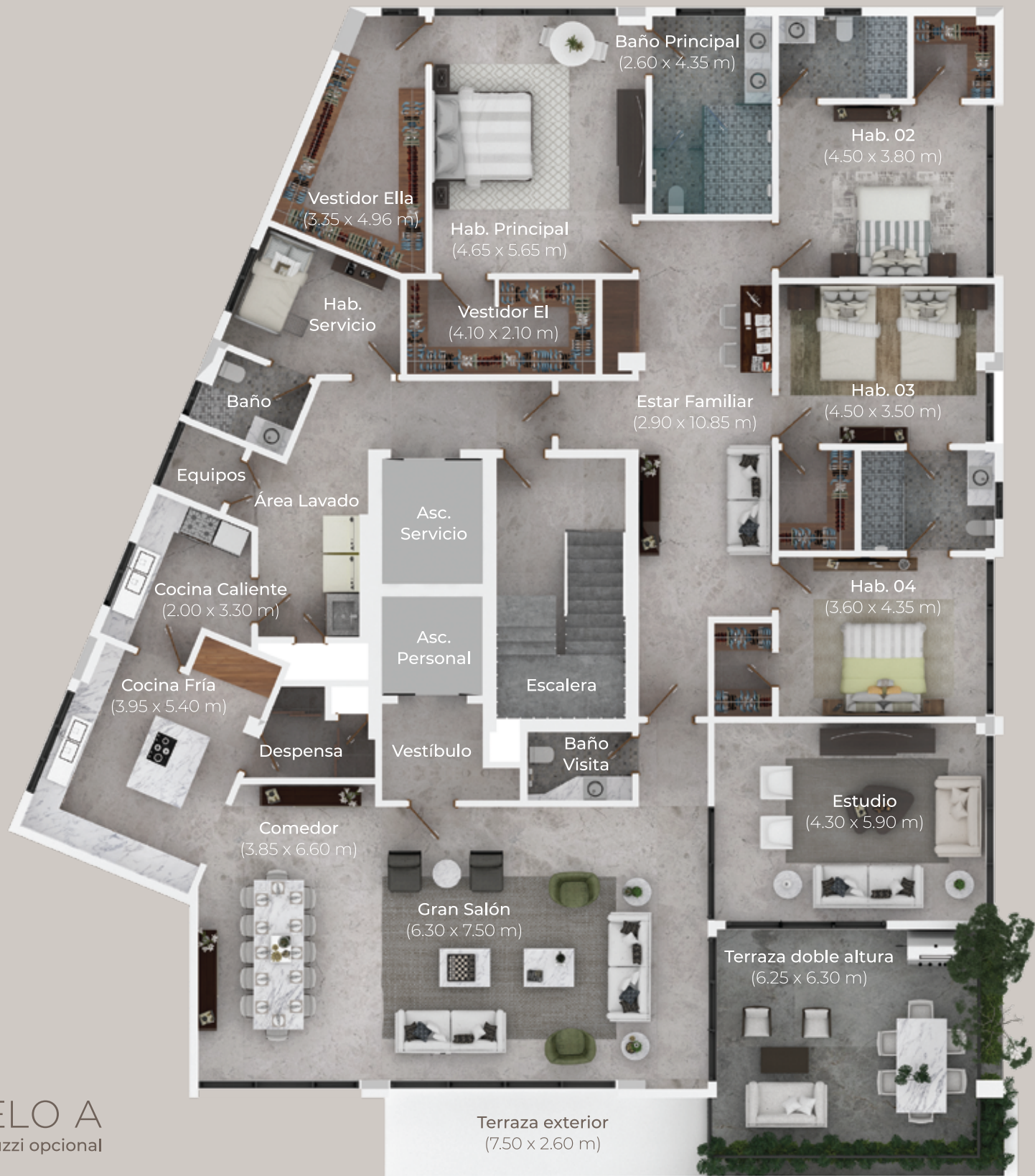
MODELO A 450 m 2 \ Jacuzzi opcional